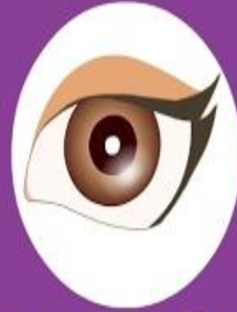
Sense of Sight