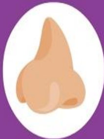
Sense of Smell