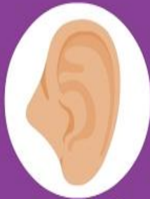
Sense of Sound