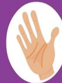
Sense of Touch