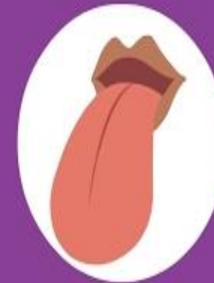
Sense of Taste